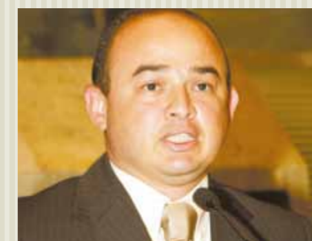
>> Deputado Sérgio Aguiar (PSB)