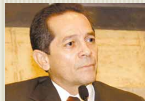
>> Deputado Heitor Férrer (PDT)