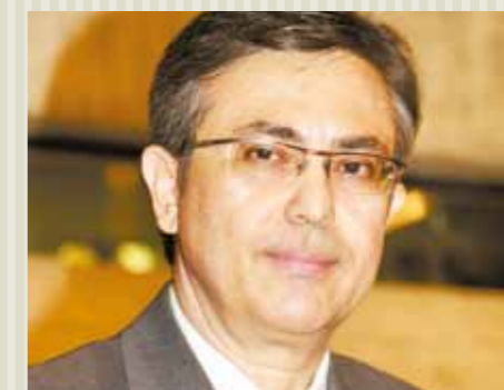
>> Deputado Adahil Barreto (PR).