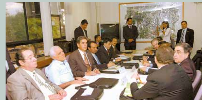
>> Presidentes das Assembleias reunidos em Brasília escolhem novo presidente da entidade

O colegiado pediu também a ampliação da prerrogativa de legislar sobre transportes, assuntos agrários, licitações, diretrizes educacionais, etc. A ideia