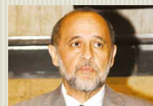
>> Deputado Hermínio Resende (PSL)