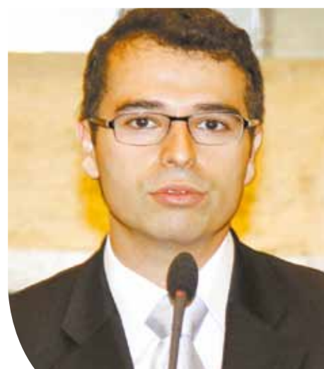
Deputado Thomás Figueiredo (PSDB).