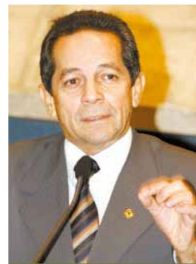
Deputado Heitor Férrer (PDT).