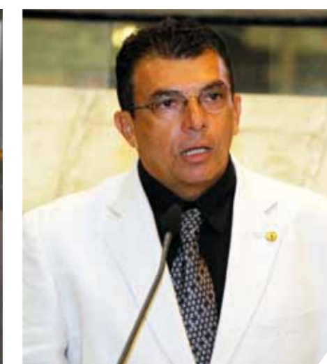
Deputado Ely Aguiar (PSDC).