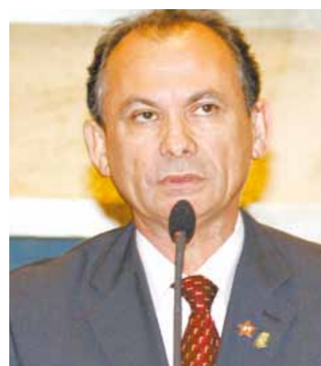
Líder do Governo, deputado Nelson Martins (PT).